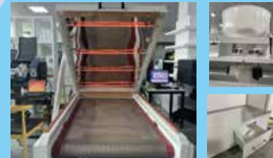
SPOLVERATRICE/ POWDER MACHINE