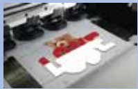
DIRECT TO FILM