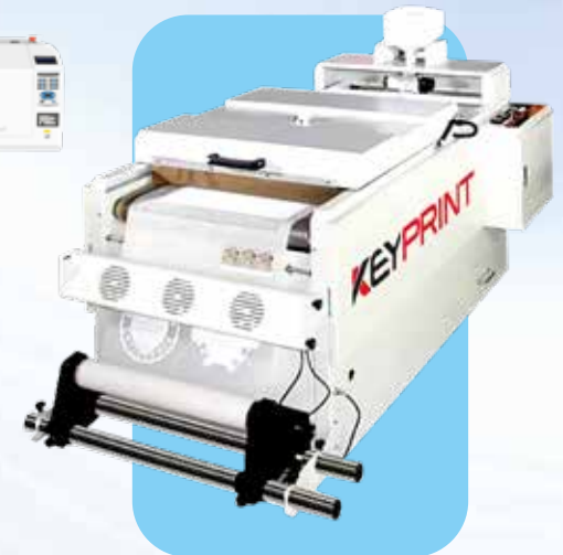
STAMPANTE DTF \ PRINTER DTF SPOLVERATRICE/ POWDER MACHINE