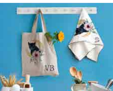
ACCESSORI E REGALI